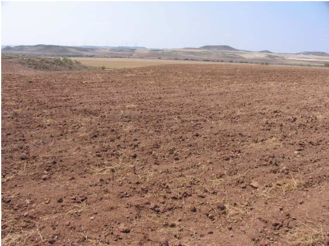
Emplazamiento del Yacimiento lítico de Fuenteempudia

En este caso nos hallamos frente a otro yacimiento lítico de superficie, situado en una zona de campos de cultivo, con características muy similares a Dehesa de la Duquesa I y II (restos líticos naturales mezclados con restos de talla).