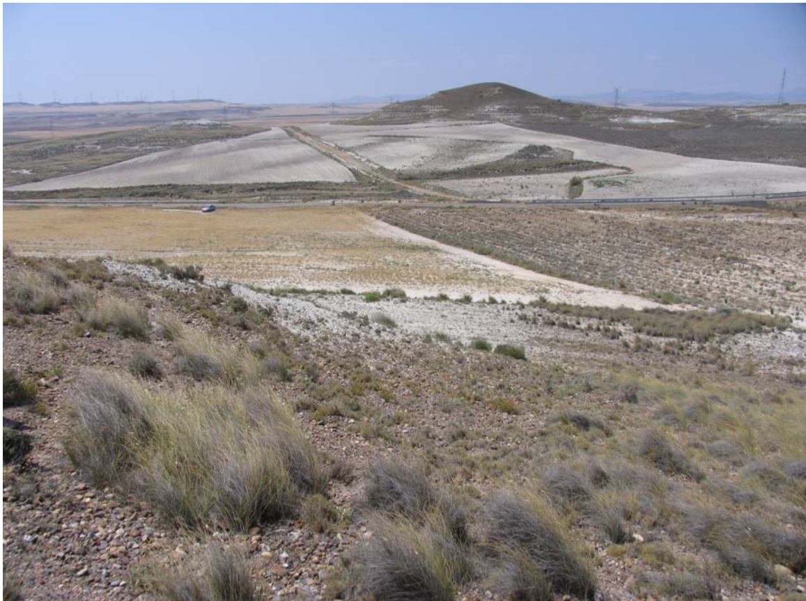
Emplazamiento del yacimiento arqueológico

Se trata de otro taller lítico de superficie, situado en este caso en la ladera de un cerro.