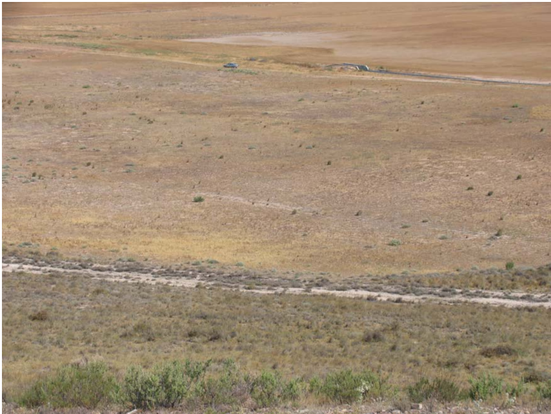
Emplazamiento del yacimiento de La Dehesa de la Duquesa II

Situado a escasa distancia de Dehesa de la Duquesa I, igualmente al pie de unas terrazas altas del Ebro en las que hay instalados varios parques eólicos. Parte de los hallazgos de sílex corresponden a restos naturales que, afectados por la erosión o por actividades agrarias, presentan roturas y morfologías que pueden inducir a confusión por su similitud con la talla intencional del sílex por parte de gentes prehistóricas.