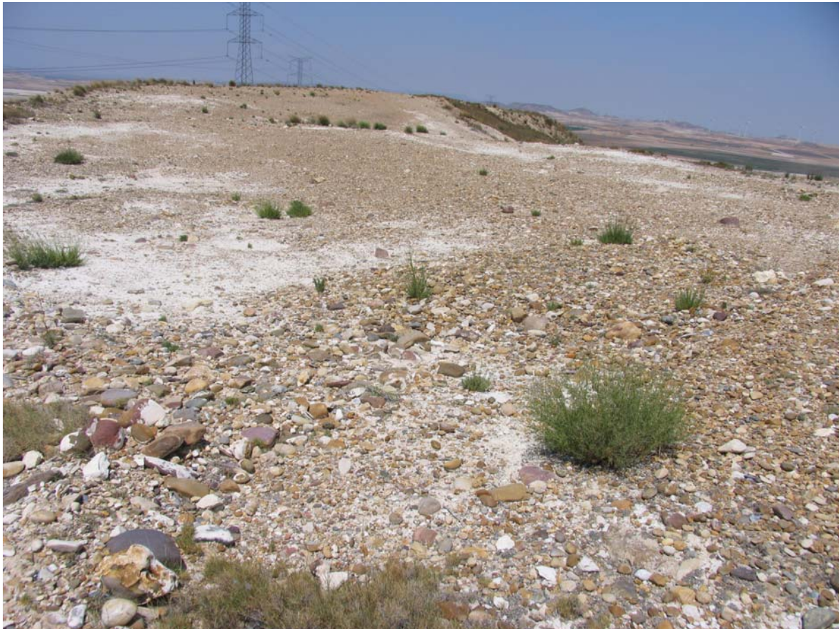
Localización del Emplazamiento del Yacimiento Herrerías

En este lugar no hemos podido localizar, pese a la prospección realizada, restos de talla de sílex, sino sólo bloques y nódulos naturales afectados por la erosión o por actividades de maquinaria (se trata de un cerro aplanado para la instalación de torres eléctricas), por lo que su carácter de yacimiento arqueológico nos resulta algo dudoso.