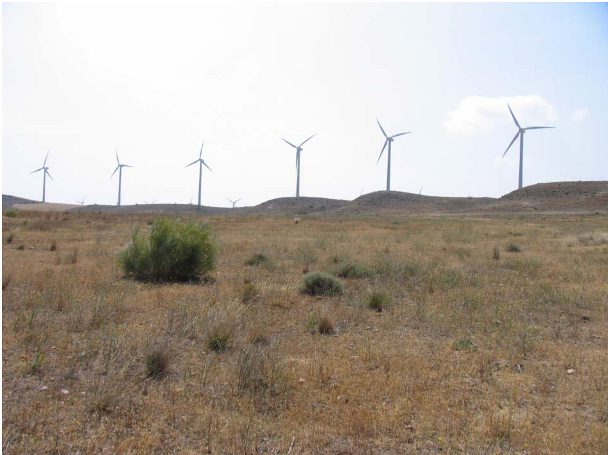
Emplazamiento del Yacimiento Lítico Dehesa de la Duquesa I

Es el primero de dos yacimientos líticos de superficie muy próximos entre sí, al pie de unas terrazas altas del Ebro en las que hay instalados varios parques eólicos. Parte de los hallazgos de sílex corresponden a restos naturales que, afectados por la erosión o por actividades agrarias, presentan roturas y morfologías que pueden inducir a confusión por su similitud con la talla intencional del sílex por parte de gentes prehistóricas.