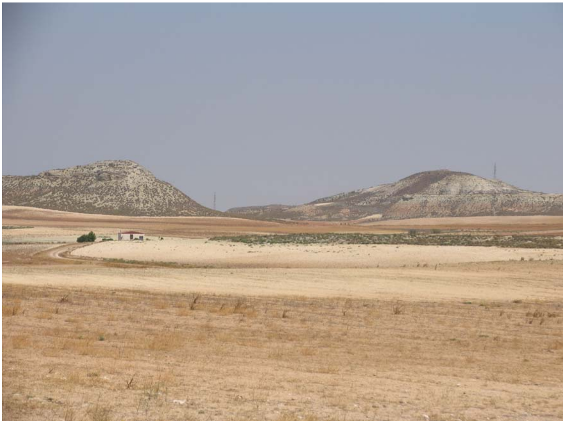
Localización de los Yacimientos de Atalaya I y II

Atalaya II. Con las mismas coordenadas que para Atalaya I, se citan en la Carta Arqueológica los restos de una posible torre de vigía medieval. Nos hallamos en el mismo caso que el anterior, no ha sido posible localizar ningún vestigio en una zona amplia alrededor de esas coordenadas.