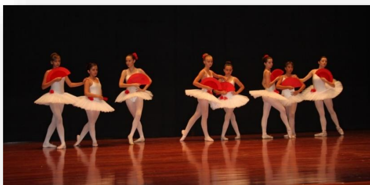
Don Quixot de Ludwig Minkus interpretado por el grupo de danza clásica de Pedrola. Auditorio de la Casa de Cultura.

Desde las instancias municipales se invitó a las asociaciones culturales y talleres relativos a artes escénicas y música a desarrollar su actividad alrededor de la figura del “Quijote”, creando así un leit motiv para este curso. El Grupo de Danza Clásica de Pedrola interpretó varias coreografías del Don