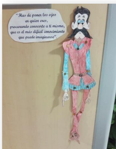
Muñeco móvil con cita del Quijote. Taller Fundación Hospital Almau.

Desde la Fundación Hospital Almau-Residencia de ancianos se han desarrollado diversas actividades, comenzando con la participación en la lectura programada por el Ayuntamiento, en el concurso de marca páginas de la biblioteca municipal. Además se proyectaron películas del Quijote en el marco de la Semana Cultural de la Residencia, se visitó la Ínsula Barataria, y también se realizó una exposición de muñecos móviles y citas del Quijote, surgida del taller artístico que los residentes realizaron a lo largo de este año.