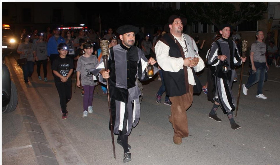
“I Andada Nocturna del Quijote”.