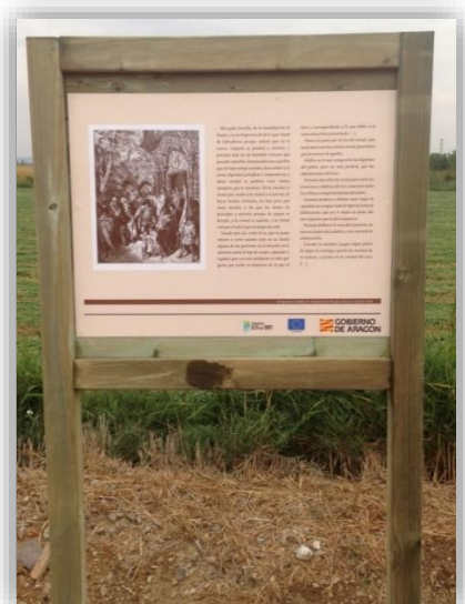
Panel turístico con cita del Quijote. Camino Pedrola-Alcalá de Ebro.