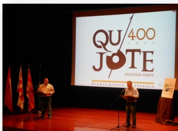
Lectura Continua de la 2ª Parte del Quijote, Auditorio de Pedrola.

Se han realizado varias lecturas ininterrumpidas de la obra de Cervantes en diferentes espacios escénicos e históricos. Se leyó la segunda parte de “El Quijote” en el Auditorio de la Casa de Cultura; cabe destacar que en esta puesta en escena contamos con algunas personalidades tanto del ámbito cultural como del ámbito político. Algunas de estas intervenciones se realizaron por medios audiovisuales consiguiendo así que el acto fuese más allá de nuestro municipio.