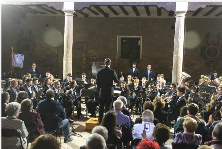
Concierto-presentación del disco “Pedrola, Patrimonio Musical” a cargo de la Banda de Música de la Asociación Musidrola. Palacio de Villahermosa.